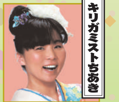
キリガミストおさき