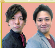
マブマンチユール